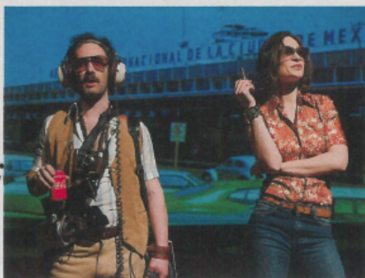
Une plongée infernale dans le destin du mystérieux écrivain B. Traven.